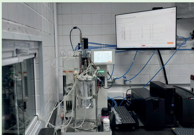
Figura 2. Biorreator do Laboratório de Engenharia de Bioprocessos, durante o ensaio de produção de VLP-Zika.

De modo simultâneo, deveriam ser estabelecidos os protocolos operacionais básicos, o treinamento dos alunos para poderem ser executados os ensaios de produção de partículas semelhantes a vírus (VLP, virus-like particles) em biorreator, assim como a regularização do laboratório perante a Comissão Técnica Nacional em Biossegurança.