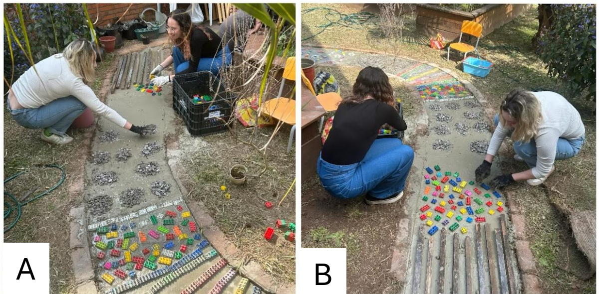
Figura 7 - Construção do caminho sensorial: (A) execução da parte com pedras de brita e (B) execução da parte com peças plásticas.

Para essa oficina, as voluntárias utilizaram argamassa para criar o caminho. Uma variedade de materiais e formas foram explorados. Os blocos tipo “Lego” foram utilizados para proporcionar textura diferenciada. Quando organizados em linhas horizontais eles oferecem padrões estruturados para exploração dos bebês e crianças e quando dispostos de forma desordenada, promovem experiências táteis e motoras variadas. As tampinhas coloridas visam reforçar estímulos visuais e trabalhar a criatividade das crianças, gerando formas como as das flores criadas. O caminho de pedras de brita, acrescentou desafio e percepção tátil diversa enquanto os pequenos montinhos de pedras adicionam irregularidades ao caminho para trabalhar o equilíbrio e a coordenação motora. Por fim, as peças de madeira integram todas as texturas e materiais utilizados (Figura 7).