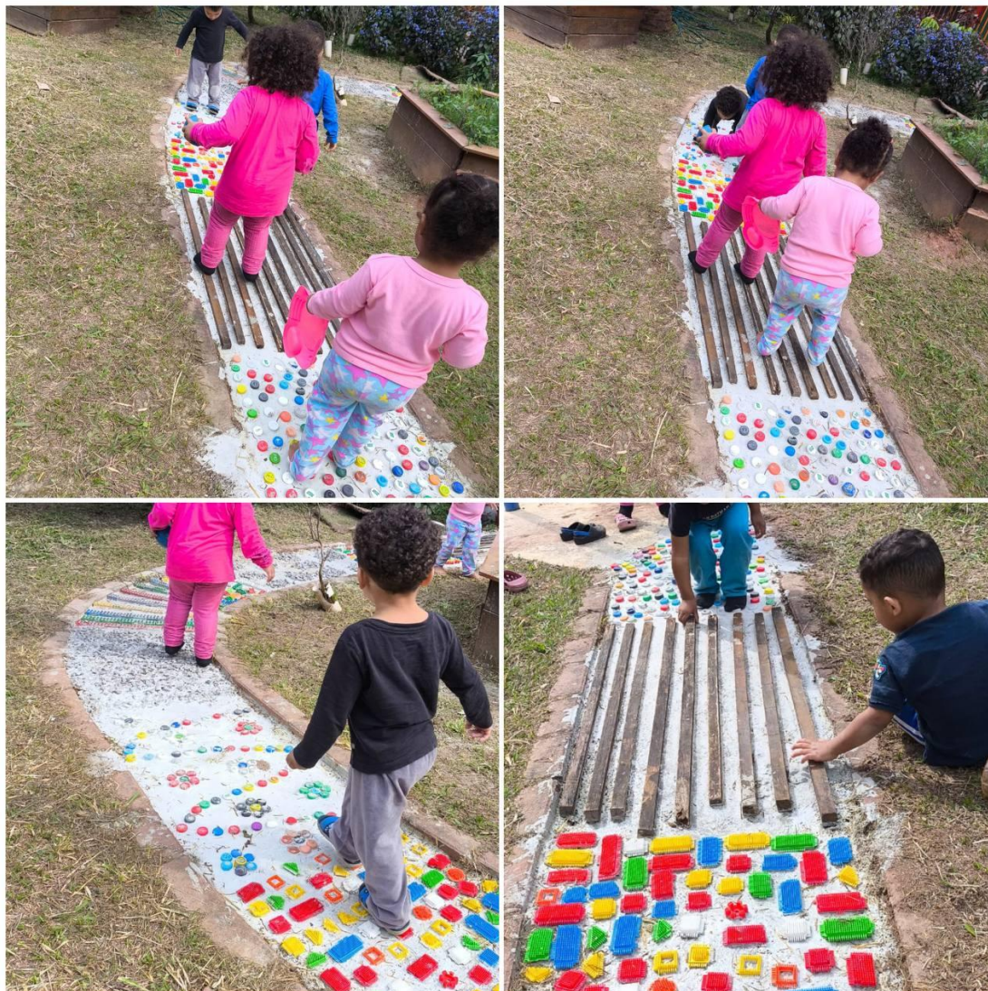
Figura 9 - Bebês e crianças explorando o caminho sensorial produzido