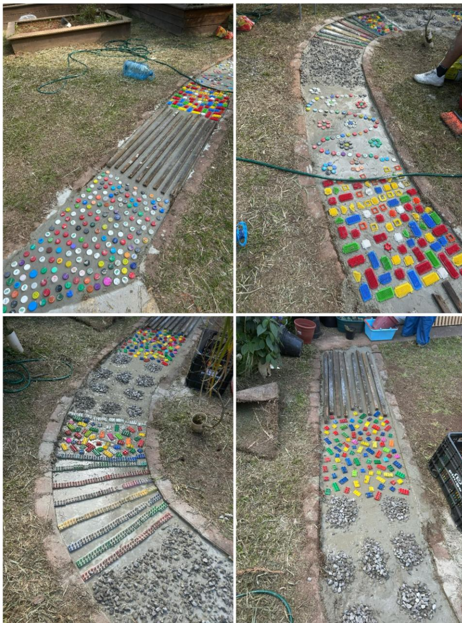
Figura 8 - Reestruturação finalizada do caminho sensorial