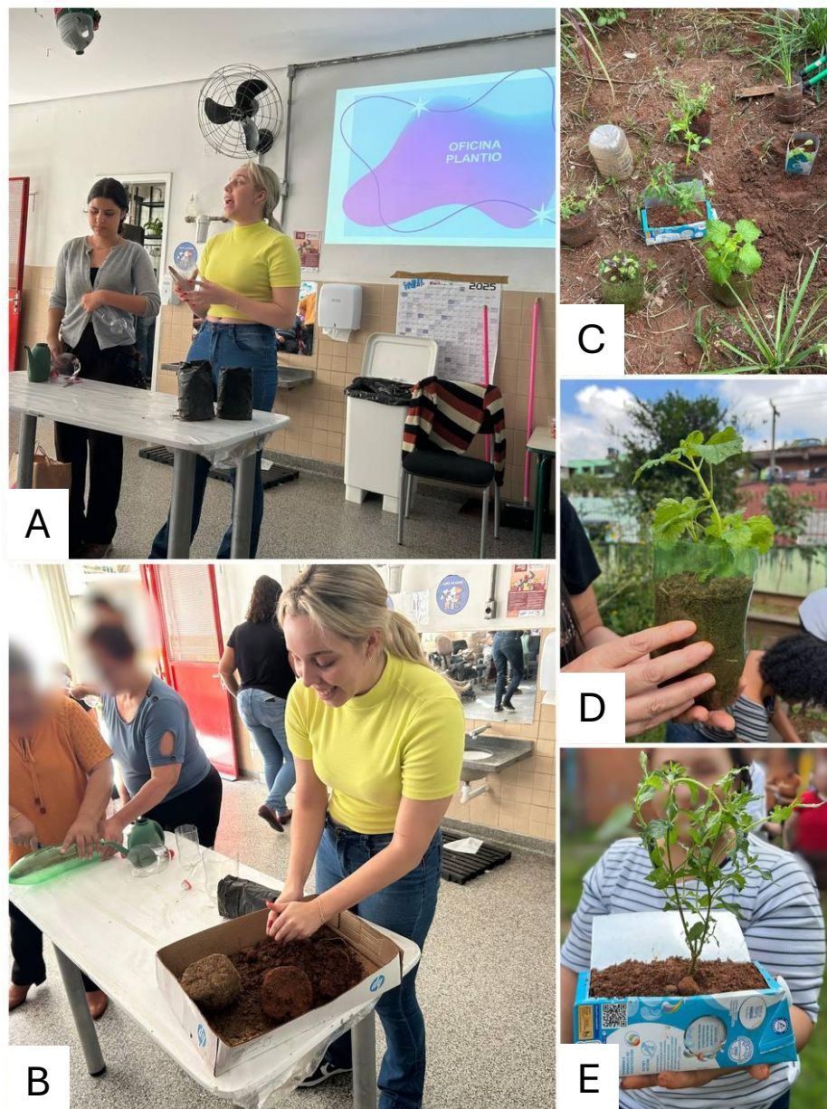
Figura 4 - Fotos da oficina de confecção dos vasos: (A) voluntárias do projeto explicando sobre a importância das plantas no cotidiano; (B) voluntária preparando a terra para uso; (C) algumas mudinhas plantadas; (D e E) mudinhas plantadas em garrafa PET e caixinha de leite