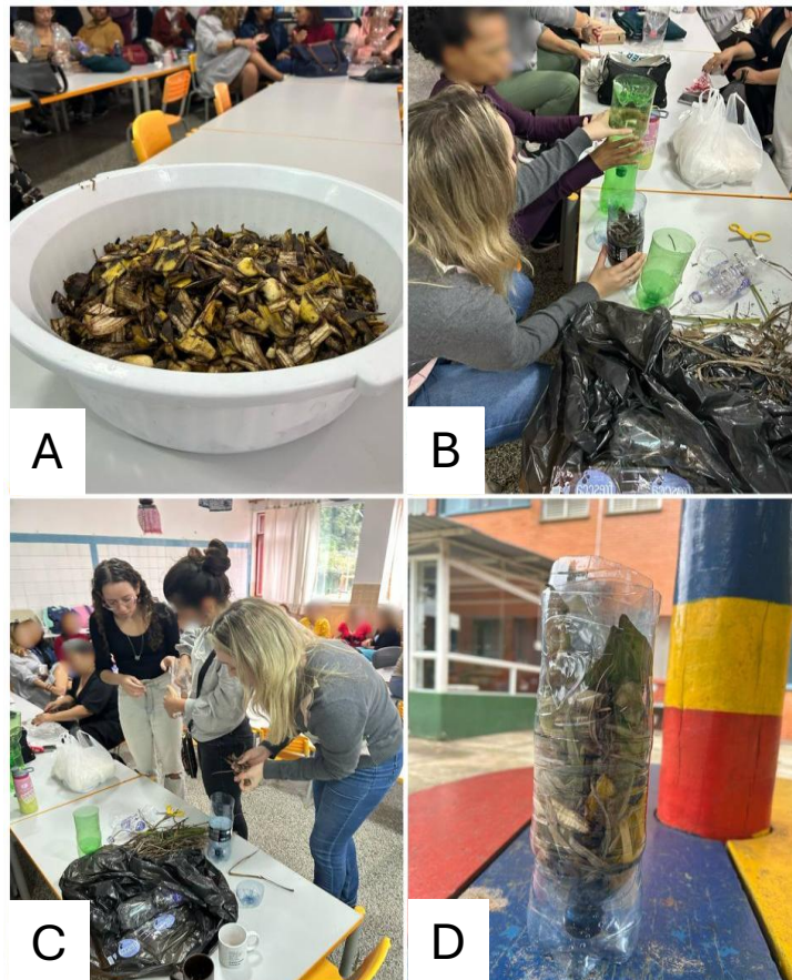
Figura 2 - Oficina de confecção da mini composteira: (A) casca de banana utilizada nas composteiras; (B e C) participantes montando as composteiras com garrafas pet; (D) mini composteira montada.