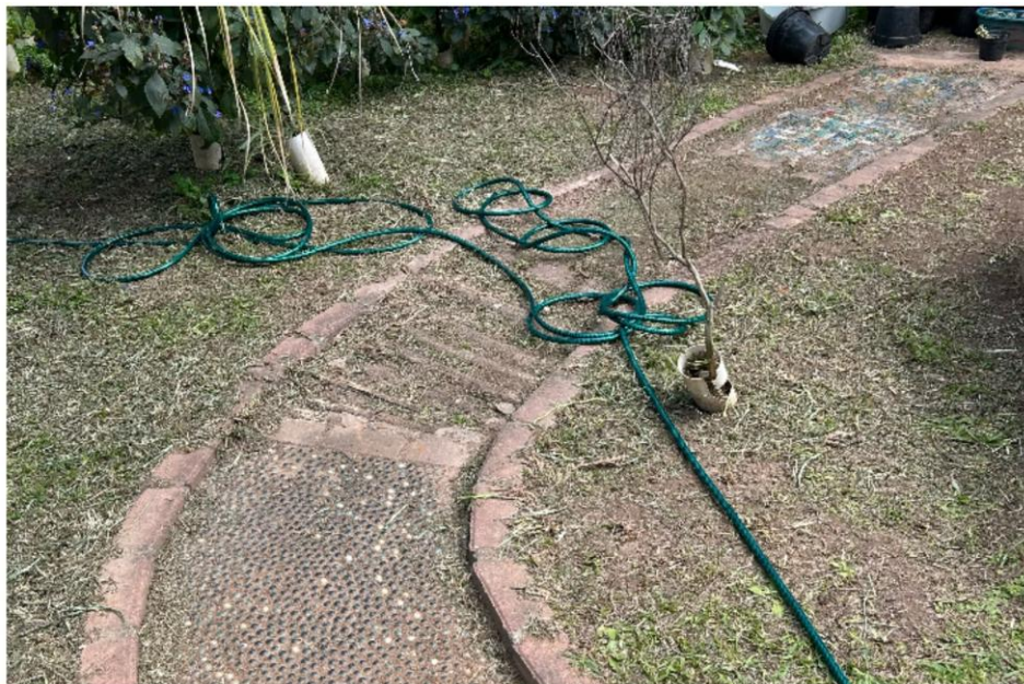
Figura 6 - Caminho sensorial inativo no CEI Cidade de Genebra

As últimas oficinas foram focadas na revitalização do caminho sensorial. O caminho sensorial representa um elemento central no desenvolvimento do jardim sensorial, oferecendo às crianças um espaço de exploração, percepção e aprendizado por meio de diferentes materiais que trazem múltiplos estímulos. Os ambientes sensoriais também são reconhecidos por seu papel no estímulo tátil, visual, auditivo e olfativo, permitindo que os alunos interajam de maneira lúdica e significativa com a natureza e com os elementos ao redor. Além de favorecer a percepção sensorial, tais espaços contribuem para o desenvolvimento cognitivo, motor e socioemocional das crianças, estimulando a curiosidade, a atenção e a capacidade de observação. Antes da intervenção do projeto, o caminho sensorial existente na escola encontrava-se inativo ( Figura 6 ), o que limitava a utilização desse recurso e a experiência educativa proporcionada pelo jardim. Desta forma era notório a necessidade de revitalização e ampliação desse percurso para tornar o ambiente mais estimulante, inclusivo e funcional.