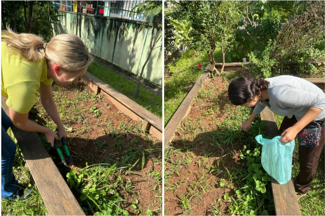
Figura 3 - Ação de limpeza da horta