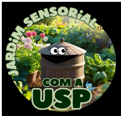
Figura 1 - Logotipo do projeto