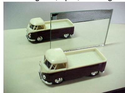
Figura 2.1 - O espelho, colocado entre dois carrinhos idênticos, aparenta ser apenas um vidro.