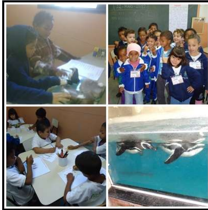
Figura 5 – Recordando momentos de estudo, motivação, interação, troca de conhecimentos e encanto com relação ao tema.