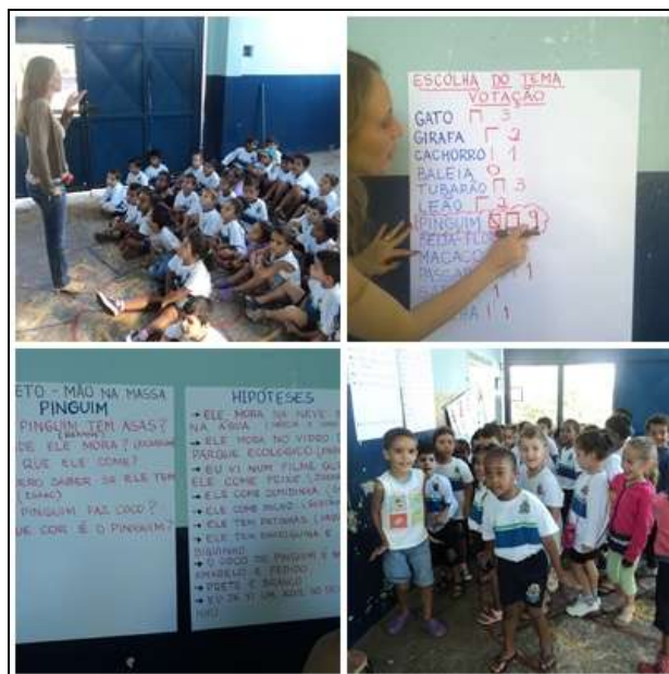
Figura 1 – Momentos do nascimento do projeto... Escolha do tema, votação, levantamento de hipóteses e registro.

As crianças registraram as hipóteses através do desenho. A figura 1 mostra etapas do projeto.