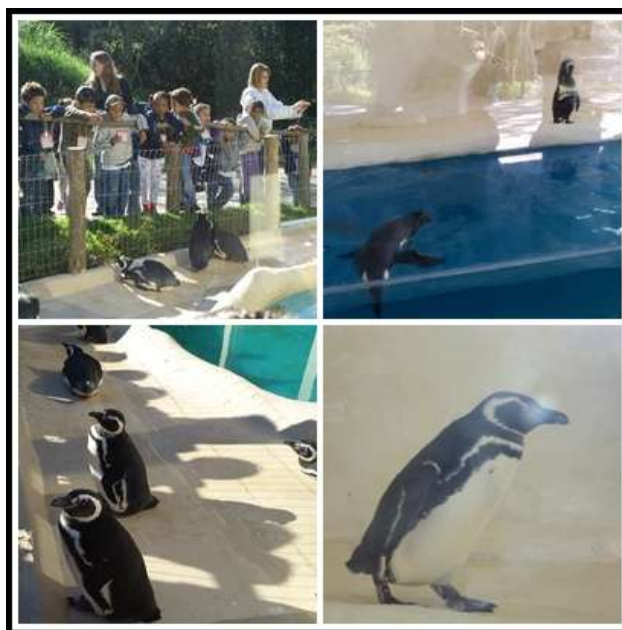
Figura 3: Visita ao Parque Ecológico de São Carlos para observação dos pinguins.

Na visita ao Parque Ecológico da cidade de São Carlos, as crianças tiveram a oportunidade de observar os pinguins de pertinho, tomando um solzinho e também nadando e se alimentando. Fotografaram e obtiveram ainda mais informações sobre os Pinguins, em especial de Magalhães, como podemos verificar na figura 3.