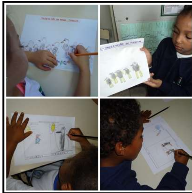
Figura 4 – Registro dos resultados e conclusões através de desenho, ou seja, comparação das hipóteses iniciais e finais.

Para finalização do projeto fizemos a comparação junto com as crianças das hipóteses iniciais e das informações obtidas durante o estudo (figura 4), discutimos e construímos um texto coletivo com as conclusões finais.