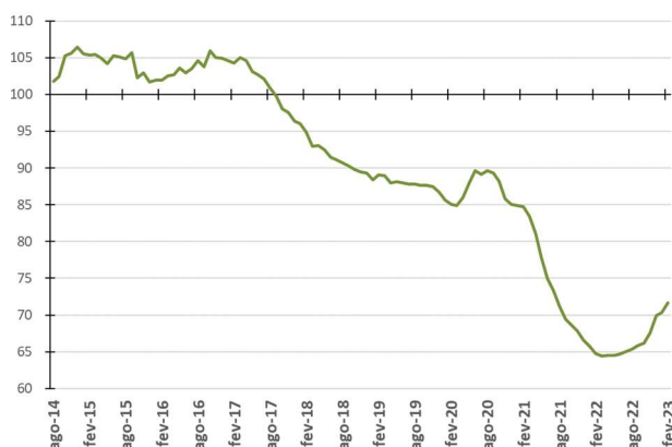
Figura 2 - Evolução da média móvel do comprometimento da receita do Tesouro com pessoal - %

Nas Figuras 2 e 4 são apresentadas as medidas de tendência dos percentuais de comprometimento anual (média móvel). Assim, cada ponto da figura representa o percentual calculado a partir da divisão do somatório das folhas de pagamento dos últimos 12 meses pelo somatório das parcelas de recursos financeiros repassados à USP nos últimos 12 meses.