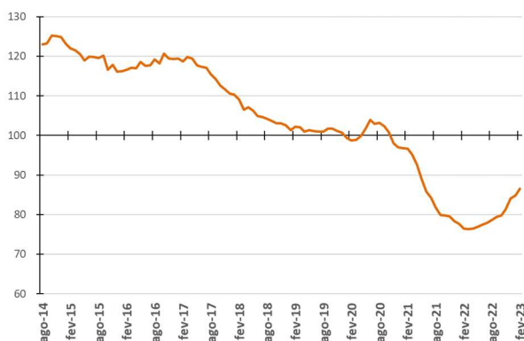
Figura 3 - Evolução da média móvel do comprometimento da receita do Tesouro com a despesa total - %

Nas Figuras 3 e 4 são apresentadas as médias móveis dos percentuais de comprometimento da receita com a despesa total em 12 meses. Assim, cada ponto da figura representa o percentual calculado a partir da divisão do somatório das despesas de pessoal, precatórios, custeio e capital nos últimos 12 meses pelo somatório das parcelas de recursos financeiros repassados à USP nos últimos 12 meses.