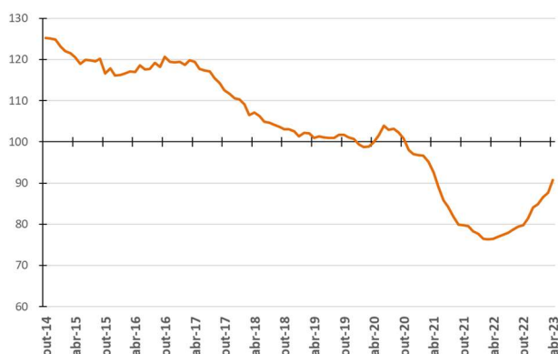
Figura 3 - Evolução da média móvel do comprometimento da receita do Tesouro com a despesa total - %

Nas Figuras 3 e 4 são apresentadas as médias móveis dos percentuais de comprometimento da receita com a despesa total em 12 meses. Assim, cada ponto da figura representa o percentual calculado a partir da divisão do somatório das despesas de pessoal, precatórios, custeio e capital nos últimos 12 meses pelo somatório das parcelas de recursos financeiros repassados à USP nos últimos 12 meses.