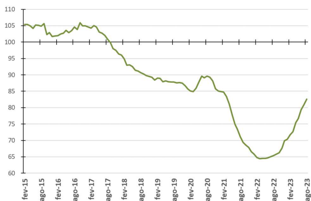
Figura 2 - Evolução da média móvel do comprometimento da receita do Tesouro com pessoal - %

Nas Figuras 2 e 4 são apresentadas as medidas de tendência dos percentuais de comprometimento anual (média móvel). Assim, cada ponto da figura representa o percentual calculado a partir da divisão do somatório das folhas de pagamento dos últimos 12 meses pelo somatório das parcelas de recursos financeiros repassados à USP nos últimos 12 meses.