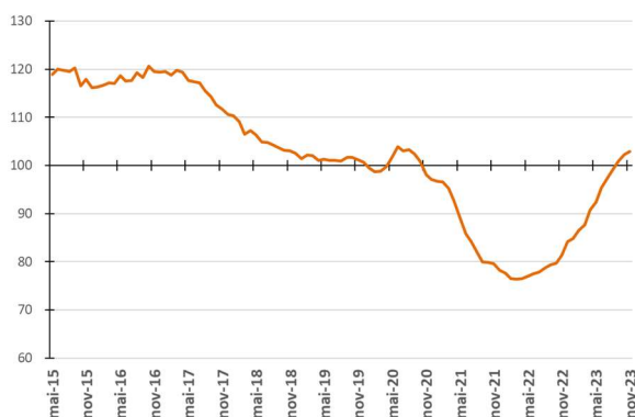
Figura 3 - Evolução da média móvel do comprometimento da receita do Tesouro com a despesa total - %

Nas Figuras 3 e 4 são apresentadas as médias móveis dos percentuais de comprometimento da receita com a despesa total em 12 meses. Assim, cada ponto da figura representa o percentual calculado a partir da divisão do somatório das despesas de pessoal, precatórios, custeio e capital nos últimos 12 meses pelo somatório das parcelas de recursos financeiros repassados à USP nos últimos 12 meses.