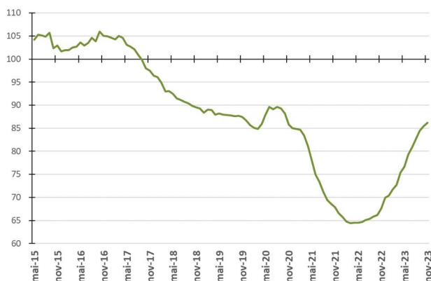
Figura 2 - Evolução da média móvel do comprometimento da receita do Tesouro com pessoal - %

Nas Figuras 2 e 4 são apresentadas as medidas de tendência dos percentuais de comprometimento anual (média móvel). Assim, cada ponto da figura representa o percentual calculado a partir da divisão do somatório das folhas de pagamento dos últimos 12 meses pelo somatório das parcelas de recursos financeiros repassados à USP nos últimos 12 meses.