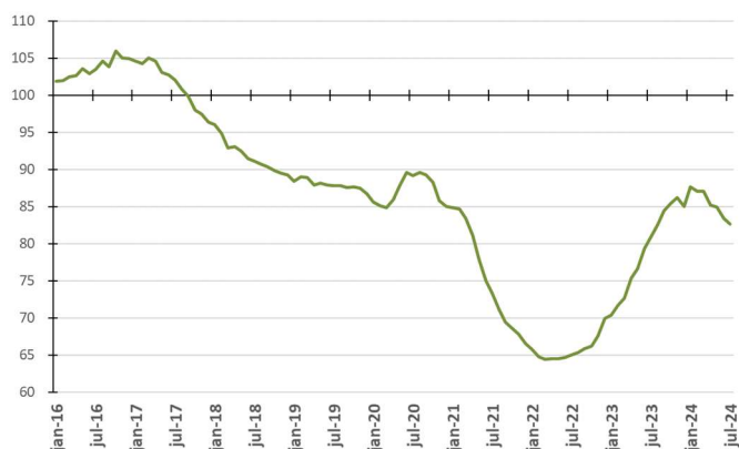
Figura 2 - Evolução da média móvel do comprometimento da receita do Tesouro com pessoal - %

Na Figura 2, são apresentadas as medidas de tendência dos percentuais de comprometimento anual (média móvel). Assim, cada ponto da figura representa o percentual calculado a partir da divisão do somatório das folhas de pagamento dos últimos 12 meses pelo somatório das parcelas de recursos financeiros repassados à USP nos últimos 12 meses.