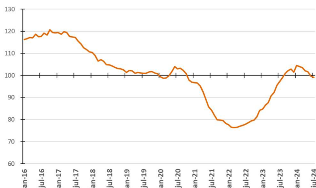
Figura 3 - Evolução da média móvel do comprometimento da receita do Tesouro com a despesa total - %

Na Figura 3, são apresentadas as médias móveis dos percentuais de comprometimento da receita com a despesa total em 12 meses. Assim, cada ponto da figura representa o percentual calculado a partir da divisão do somatório das despesas de pessoal, precatórios, custeio e capital nos últimos 12 meses pelo somatório das parcelas de recursos financeiros repassados à USP nos últimos 12 meses.