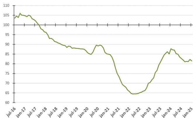
Figura 2 - Evolução da média móvel do comprometimento da receita do Tesouro com pessoal - %

Na Figura 2, são apresentadas as medidas de tendência dos percentuais de comprometimento anual (média móvel). Assim, cada ponto da figura representa o percentual calculado a partir da divisão do somatório das folhas de pagamento dos últimos 12 meses pelo somatório das parcelas de recursos financeiros repassados à USP nos últimos 12 meses.