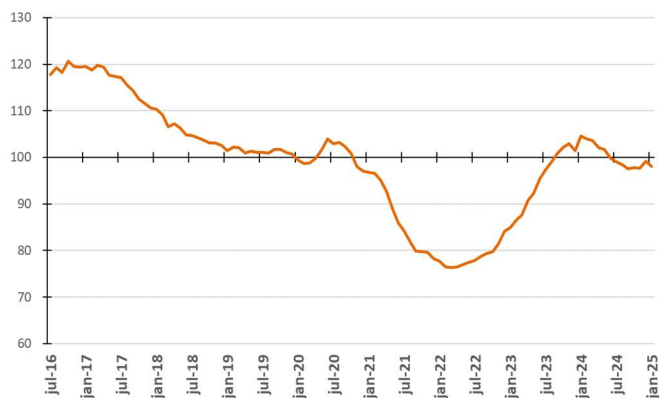
Figura 3 - Evolução da média móvel do comprometimento da receita do Tesouro com a despesa total - %

Na Figura 3, são apresentadas as médias móveis dos percentuais de comprometimento da receita com a despesa total em 12 meses. Assim, cada ponto da figura representa o percentual calculado a partir da divisão do somatório das despesas de pessoal, precatórios, custeio e capital nos últimos 12 meses pelo somatório das parcelas de recursos financeiros repassados à USP nos últimos 12 meses.