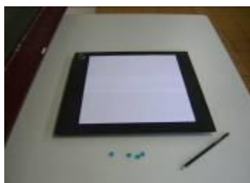
Fig. 3: Placas dispostas na posição indicada para a realização da atividade.

Para a realização da atividade, três tarefas são solicitadas aos alunos: