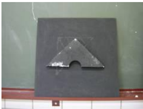
Fig. 2: Alguns exemplos de alvos utilizados na atividade.

Para a realização da atividade, grupos de 4 ou 5 alunos já recebem montado o material da atividade que consiste de uma placa de madeira de aproximadamente 1\text{ m}^2 , na qual estão fixados pedaços de isopor na forma de uma figura geométrica, regular ou não (Fig. 2). Além disso, recebem uma quantidade de bolinhas de vidro, cujo diâmetro permite que passem sob a placa e atinjam o alvo (isopor). Atirando as pequenas bolinhas sobre o alvo, os alunos deverão inferir a forma do objeto pela análise das trajetórias das mesmas. Através desse processo, eles deverão fazer uma representação (desenho) do objeto invisível. Para a solução não ser demasiado simples, as formas são compostas, como triângulos colados simetricamente, ou semicírculos colados paralelamente. As duas figuras abaixo são exemplos de “alvos” ocultos usados na atividade.